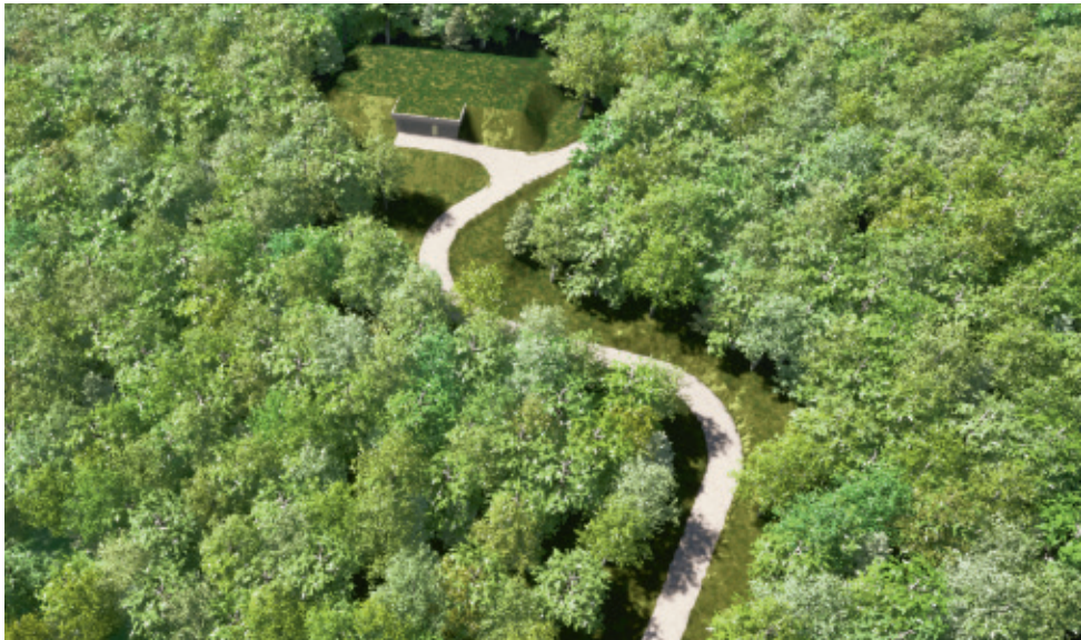
Visualisierung Zufahrt und Reservoir

Das Reservoir besteht aus zwei Wasserkammern mit einem Grundriss von je 17x17 Meter. Die nutzbare Höhe für die Wasserspeicherung beträgt 5 Meter. Damit ergibt sich ein Wasserspeichervolumen von rund 2'900 m 3 . Davon sind 600 m 3 als Löschwasserreserve vorgesehen. Neben den Wasserkammern wird das Bedienhaus erstellt. Im Bedienhaus sind die erforderlichen Rohrleitungen und Armaturen, Mess- und Steuerungsanlagen untergebracht. Ebenso erfolgt über das Bedienhaus der Zugang zu den Wasserkammern für Reinigungsarbeiten.