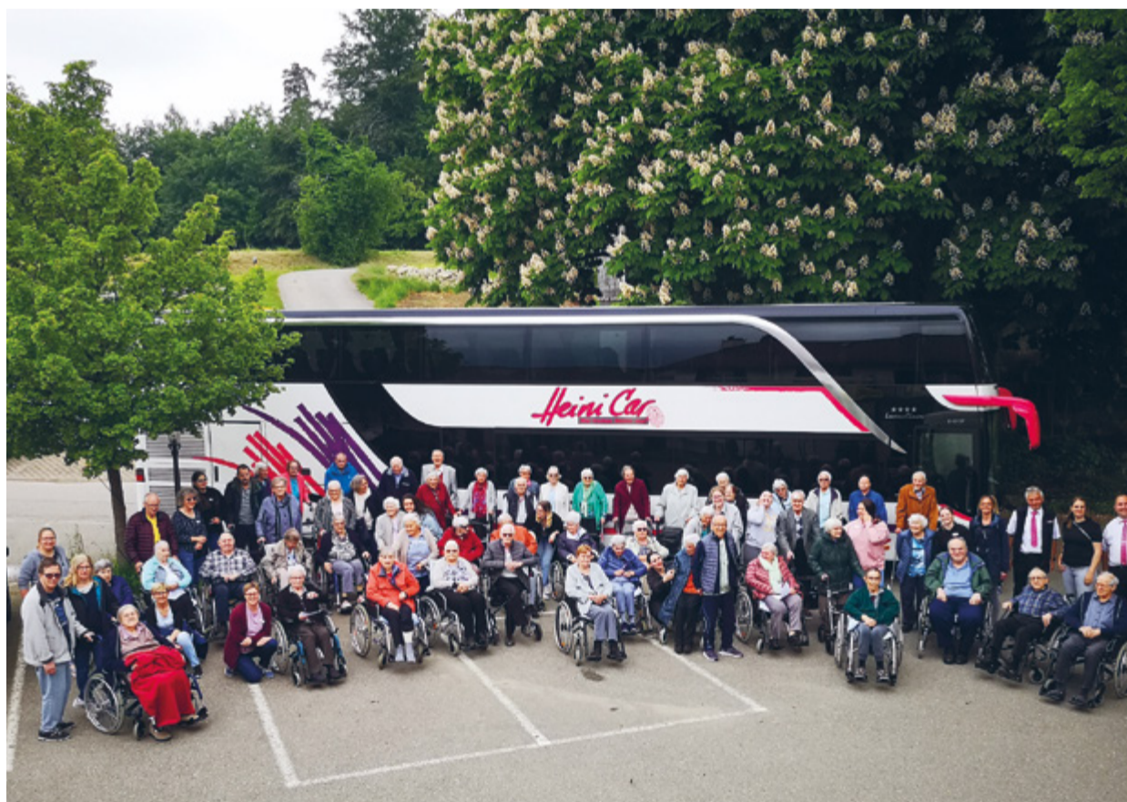
Die Bewohnerinnen und Bewohner genossen den Ausflug zum Stelzenhof.

Die IG WinterBAR betreibt auf dem Gemeindeplatz Aadorf in der Adventszeit eine Glühweinbar. Der Erlös wird jeweils gespendet oder für wohltätige Zwecke eingesetzt. Mit dem Erlös 2022 konnte das OK der WinterBAR den Bewohnerinnen und Bewohnern des Alterszentrums dieses hoffentlich unvergessliche Erlebnis ermöglichen. Im letzten Jahr ging die Spende an den Rotkreuzfahrtdienst, den Natur- und Vogelschutzverein und HELP Jugend-Samariter Aadorf. Ziel ist es auch im nächsten Jahr, den Gewinn aus der WinterBAR für einen gemeinnützigen Zweck einzusetzen.