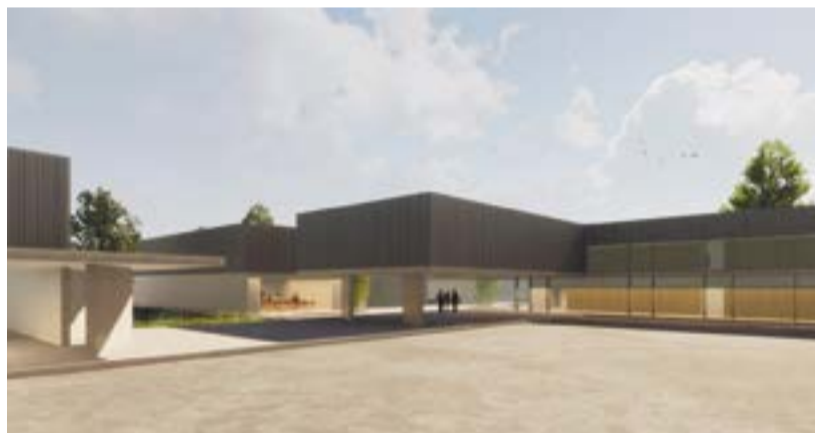
Eine Visualisierung aus dem Vorprojekt zeigt, wie die Schulanlage Löhracker einst aussehen könnte. Die definitive Ansicht wird erst im konkreten Bauprojekt entworfen.

Gebäude möglichst gut ins bestehende Areal einfügen und möglichst wenig Land verbrauchen. So bleiben noch genügend Grünflächen zum Spielen und Trainieren. Der Grenzabstand zum Wohnquartier ist doppelt so gross vorgesehen, wie gesetzlich nötig. Ausserdem sollen die Gebäude einen Innenhof bilden - damit wird die Schulanlage optimal gegenüber dem Wohnquartier im Osten abgegrenzt.