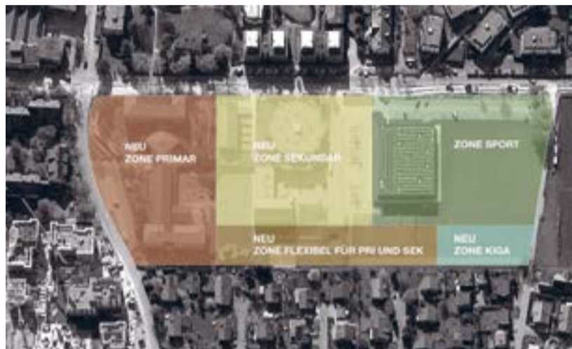
Die Schulanlage Löhracker erhält eine klare Gliederung in eine Primar-, Sekundar- und Sportzone.

Ein Architektenteam aus Kreuzlingen hat ein Vorprojekt im Sinne einer Machbarkeitsstudie erarbeitet. Das Vorprojekt sieht drei Neubauten vor: Ein Schulhaus, drei Kindergärten und eine Turnhalle mit einem Gebäude für die Betreuung. Im Projektentwurf wurde darauf geachtet, dass sich die