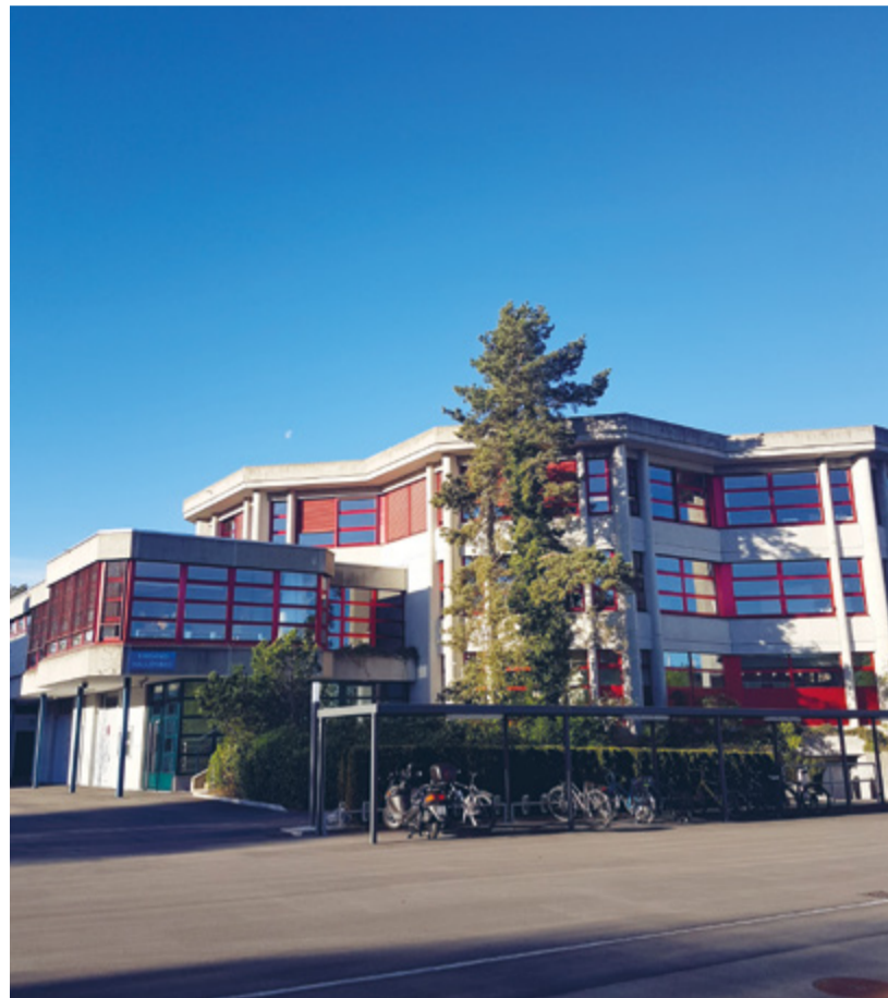
Die Sek Nord ist sanierungsbedürftig.

Das Projekt sieht eine zweckmässige und zukunftsgerichtete Sanierung des Innenraums und der Gebäudehülle vor. Mit der Innensanierung werden die stark abgenutzten Bauteile und die Haustechnik erneuert sowie die Schulzimmer für einen zeitgemässen Unterricht modernisiert. Die Boden- und Wandbeläge werden erneuert, die Beleuchtung sowie die sanitären Anlagen ersetzt. Durch die optimierte Anordnung der Bauteile kommt zusätzliches Tageslicht ins Gebäude, was die Lernatmosphäre für die Schulkinder deutlich verbessern wird. Die Sanierung der Gebäudehülle hilft dabei,