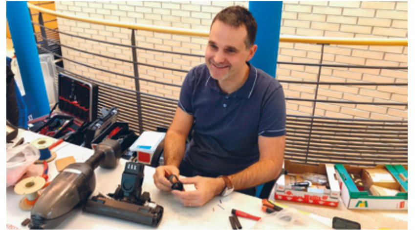
Ein Staubsauger in Reparatur.

Repair Cafés bieten die Möglichkeit, konkret etwas gegen den Ressourcenverschleiss, die Wegwerfwirtschaft und die wachsenden Abfallberge zu unternehmen. Zudem lernen Besucherinnen und Besucher, wie Geräte