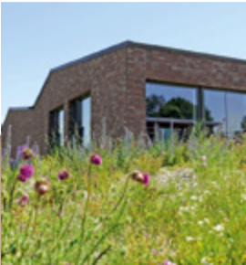
Beim Neubau des Schulhauses Hagen in Illnau wurde eine Ruderalfläche angelegt.

Förderung der Biodiversität im öffentlichen Raum. Fachexperten zeigten, wie die Gemeinden ihre Flächen gezielt umgestalten können, um sie der Natur zur Verfügung zu stellen. Die Fachgruppe geht nun einen Schritt weiter und will auch private Haushalte für das Thema sensibilisieren. Die Stadt Illnau-Effretikon und Lindau haben eine Informationskampagne zur Biodiversität konzipiert, die nun von den Gemeinden der Region Frauenfeld übernommen wird. Auch dem Kanton Thurgau ist das Thema wichtig. Bis im Herbst 2024 erarbeitet er eine Webseite für alle, die mehr für die Natur tun möchten. Weitere Informationen folgen.