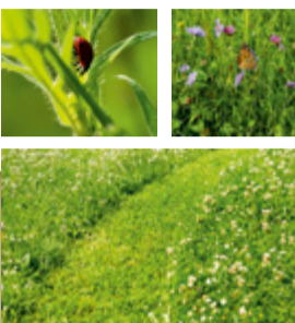
Leben zieht ein, wenn auf Grünflächen Wildblumen und Kräuter wachsen. Gemähte Wege erleichtern den Zugang zu weniger genutzten Bereichen im Garten.