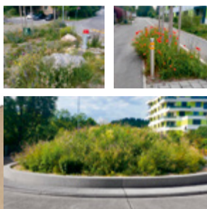
Die Grünflächen am Strassenrand, rund um Bäume oder in Kieseln bieten Raum für Kräuter und Wildblumen.

Wollen Sie Grünflächen in Ihrem Garten umgestalten? Wir geben Ihnen gerne Empfehlungen ab. Auch für die Beseitigung von invasiven Neophyten wie Kirschlorbeer oder Sommerflieder können Sie sich gerne an uns wenden.