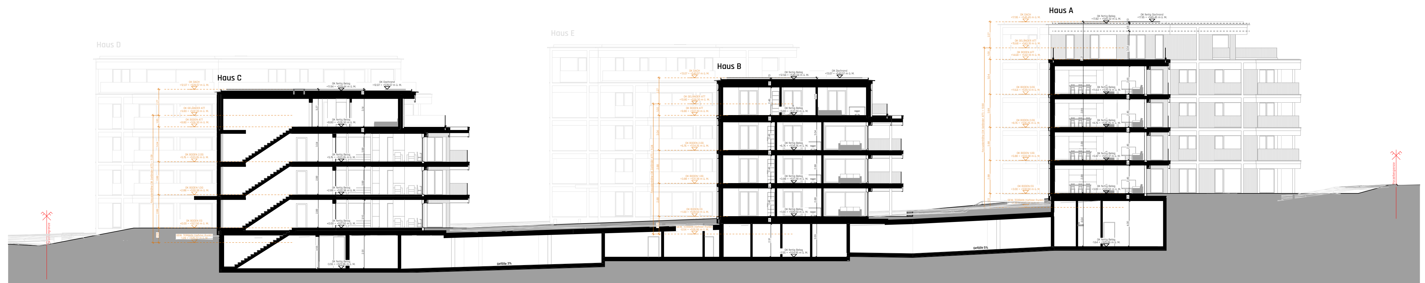
Längsschnitt Haus A/B/C