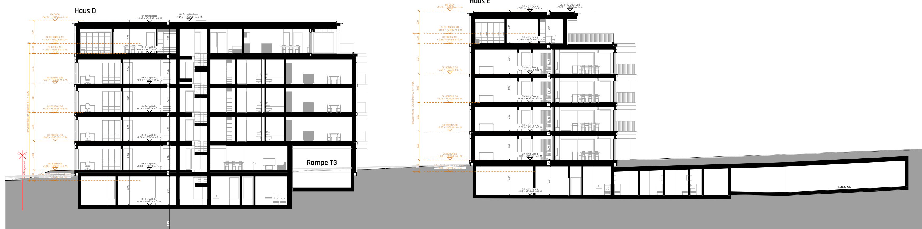
Längsschnitt Haus D/E