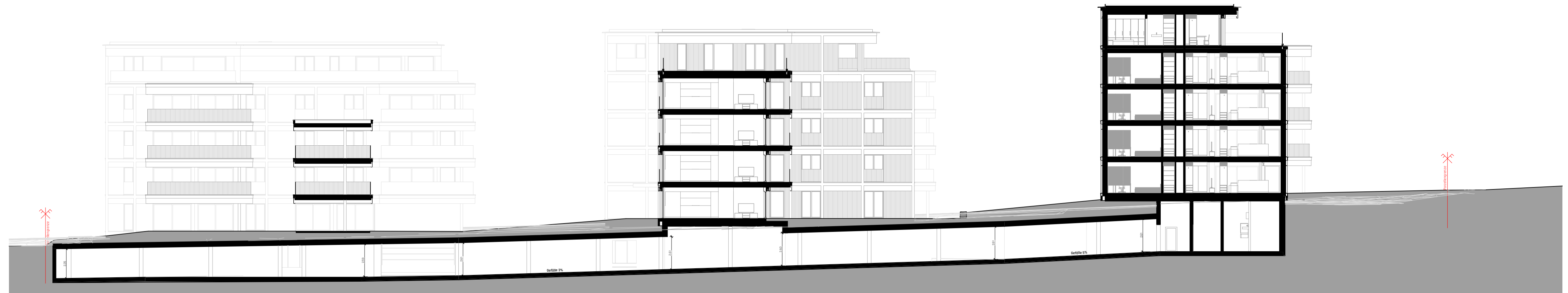
Längsschnitt TG PP