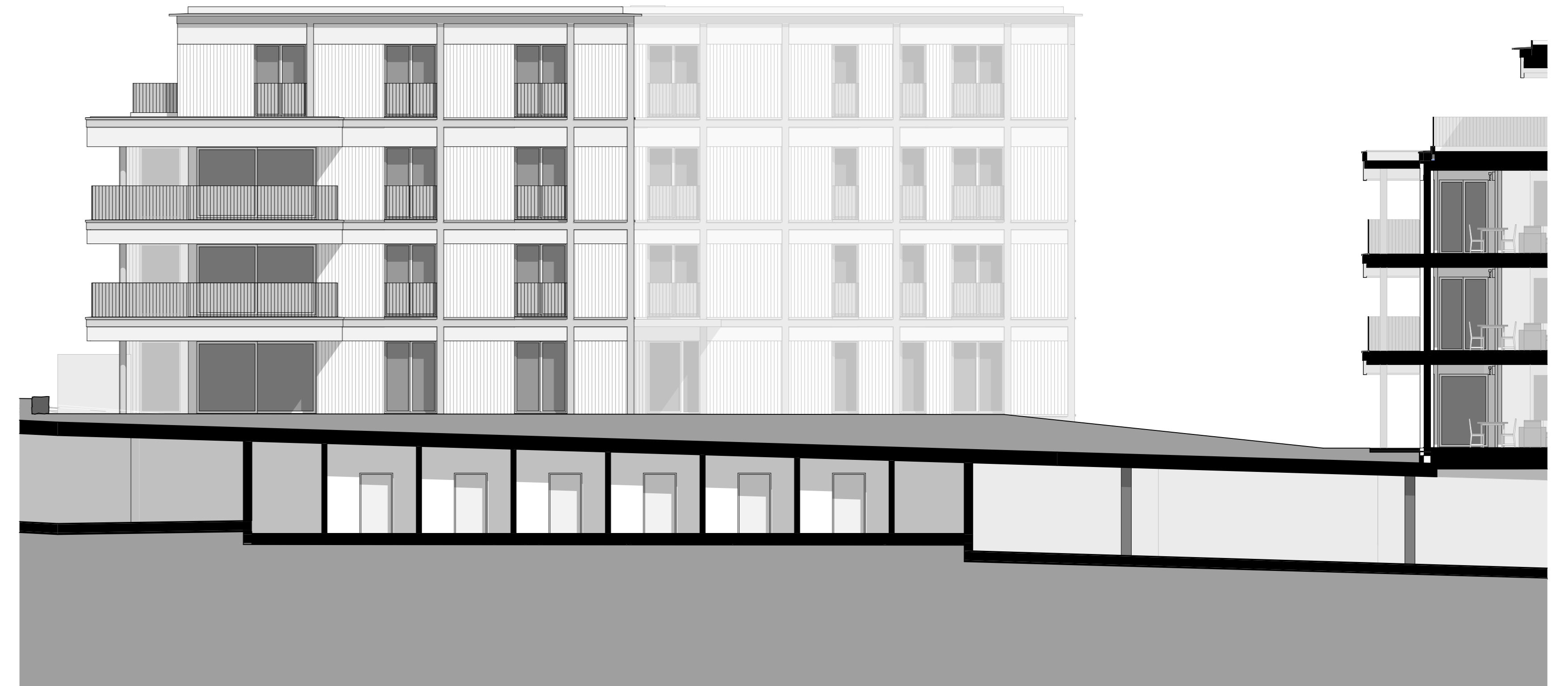
Ostfassade Haus B