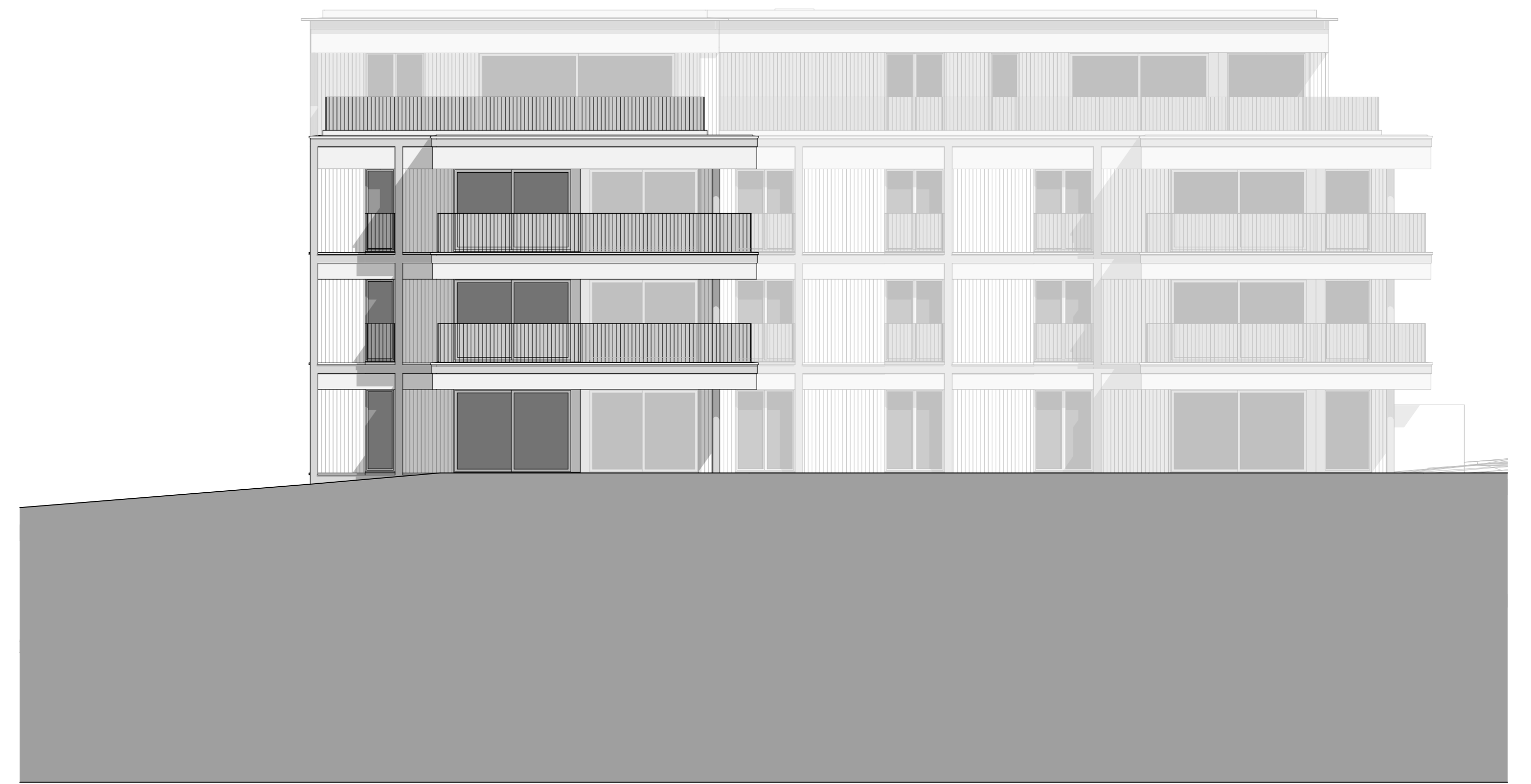
Westfassade Haus B