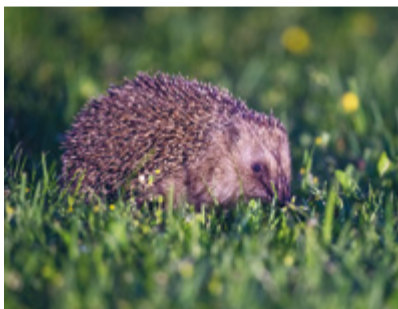
Mähroboter erkennen auf dem Rasen nach Nahrung suchende Igel oft nicht als Hindernis und verletzen die Tiere beim Überrollen.

Viele Hausbesitzer nutzen Mähroboter, um ihren Rasen ohne grossen Aufwand in Form zu halten. Vielen ist dabei nicht bewusst, dass Mähroboter für Kleintiere (Insekten, Amphibien, Reptilien, etc.) aber auch für Igel sehr gefährlich sind. Mähroboter erkennen Igel vielfach nicht als Hindernis (und drehen ab) sondern überrollen die sich einrollenden und totstellenden Igel. Vor allem kleine Jungtiere sind