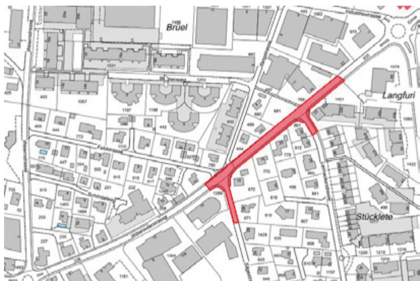
Ausschnitt des betroffenen Abschnittes in der Wittenwilerstrasse, Leimackerstrasse und Sägestrasse.