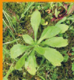
Überwinterung als Rosette