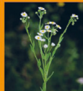
Behaarte Stängel, oben verzweigt, bis 1,5 m hoch