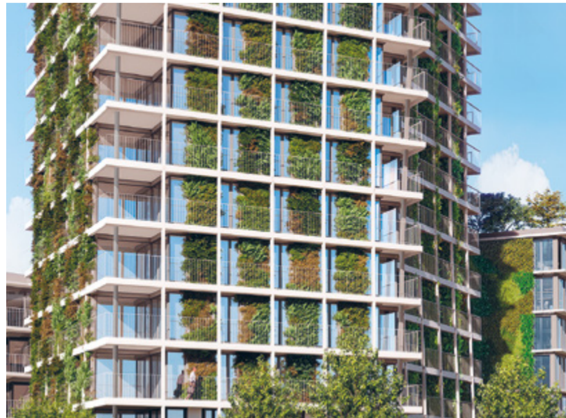
Mit einer begrünten Fassade, lebt es sich nicht nur angenehmer, sondern auch schöner.

Grünflächen und Vegetation tragen nicht nur zur Temperaturregulierung