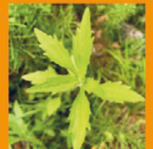
Hellgrüne behaarte Blätter, am Rand grob gezähnt