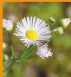
Blütenkörbchen 1–2 cm breit, viele schmale Zungenblüten in weiss bis lila, blüht von Mai bis Oktober