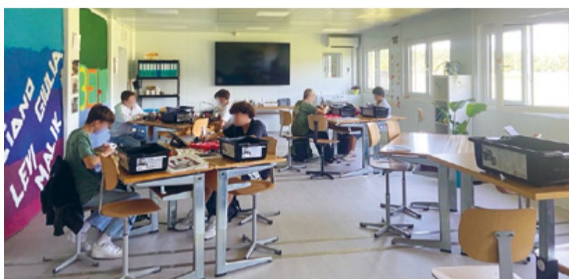
«Schulzimmer im Containerdorf»

Der budgetierte Aufwand steigt im Vergleich zum Budget 2025 um 6.2 Prozent auf rund 27 Millionen Franken. Die schulergänzende Betreuung wird mit der Integration der Mittagstische von Ettenhausen und Guntershausen zu höheren Kosten führen. Ebenfalls steigen die Personalkosten. Zusätzliche Kosten im Bereich der Energie, Wasser, Entsorgung, Honorare und baulicher Unterhalt sowie höhere Abschreibungen belasten die Aufwandseite. Im Budget 2026 werden auf der Ertragsseite rund 27.1 Millionen Franken veranschlagt. Im kommenden Jahr gehen wir bei den Kantonsbeiträgen von 2.1 Millionen Franken und höheren Steuererträgen bei natürlichen und juristischen Per-