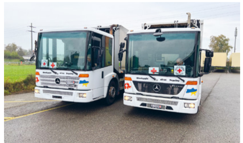
Eine kurze Verschnaufpause am Zoll in Konstanz – bevor es für die beiden Chauffeure weiter in die Ukraine geht.

dass ökologische Verantwortung und menschliche Solidarität Hand in Hand gehen können. «Unsere neuen Elektrofahrzeuge stehen für eine nachhaltige Zukunft und unsere Spende für gelebte Solidarität. Beides sind Werte, die uns als Verband wich-