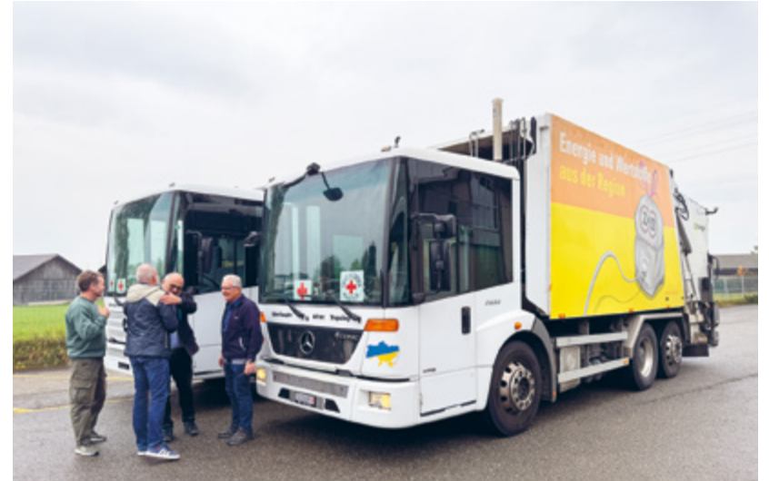
Abschied der beiden ehrenamtlichen Chauffeure – auf ihrer langen Reise in die Ukraine.)