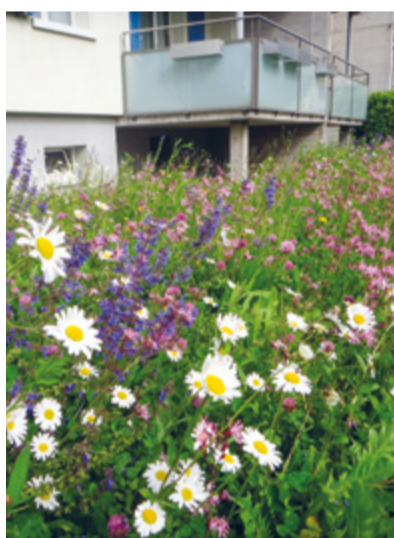
Blumenwiese im Siedlungsraum statt Einheitsgrün.

Die Umwandlung von Monokulturen hin zu Mischungen mit Gräsern, Wildblumen oder bodennahen Kräutern, zum Beispiel in Teilflächen oder als No-Mow-Zonen, bieten Nahrung und