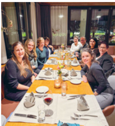
Betreuungspersonen des Tagesfamilienvereins Aadorf zusammen mit Vorstand, Geschäftsstellenleiter und Koordinatorin im Restaurant Heidelberg.

Der Dankesanlass wurde in dieser Form zum letzten Mal durchgeführt. Ab Januar 2026 bündeln der Tages-