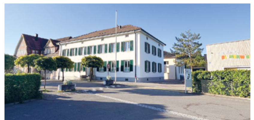
Die neu sanierte Schulverwaltung

Buche. Der restliche Betrag verteilt sich auf fünf Objekte, welche über der Aktivierungsgrenze von 75'000 Franken liegen. Hierzu zählen auch die Sanierung des Flachdachs der Pausenhalle Sekundarschule mit 172'000 Franken und der Sportboden der grossen Turnhalle Guntershausen mit 85'000 Franken. Das Schulhaus Guntershausen bedarf einer umfassenden Sanierung, welche aufgrund der Ablehnung des Neubaus nun vorgezogen wird. Hierzu sollen mit einer Vorstudie erste Abklärungen getroffen werden mit Kosten von 180'000 Franken. Die Schulzimmerausstattung in der Primarschule wird mit einer weiteren Etappe ergänzt. Die damit zusammenhängenden Anpassungen umfassen die Beleuchtung sowie neue Screens als Ersatz für Wandtafeln und Beamer. Dafür sind 503'000 Franken budgetiert. Für den geplanten Neubau wurde ein Bauerneuerungsfonds gebildet. Per Ende Dezember 2024 liegen 1.7 Million Franken darin. Dieser Fonds wird nun