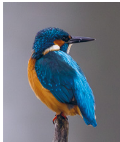
Männlicher Eisvogel am Flachsee (Reuss).

Der Eisvogel ist auf langsam fließende oder stehende Gewässer angewiesen. Für sein Vorkommen sind eine grosse Anzahl kleiner Fische, klares Wasser und genügend Ansitzmöglichkeiten wie Äste oder Steine entscheidend, von denen aus er nach Beute Ausschau hält. Sobald er einen Fisch erspäht, taucht er blitzschnell kopfüber ins Wasser, packt das Tier mit seinem langen Schnabel, kehrt zurück auf einen Ansitz und verschlingt die Beute kopfvoran. Für die Aufzucht seiner Jungen braucht der Eisvogel steile, unbewachsene Sand- oder Lehmwände, in die er seine Bruthöhle hinein gräbt. Solche natürlichen Uferabbrüche entstehen häufig durch Hochwasserereignisse und die natürliche Dynamik der Gewässer.