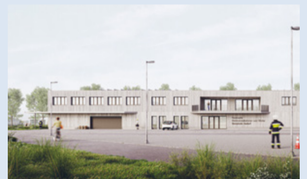
Grosszügige Fahrzeughallen und Betriebsflächen schaffen optimale Bedingungen für Feuerwehr und EW Aadorf (Visualisierung).

lungen im Bausektor wird aktuell mit Gesamtkosten von rund 19,45 Millionen Franken gerechnet. Der Gemeinderat verfolgt weiterhin das Ziel, die ursprünglich angestrebte Kostenvorgabe von 18,9 Millionen Franken einzuhalten. Deshalb werden derzeit zusätzliche Optimierungen geprüft, mit denen Einsparungen von rund 500.000 Franken erzielt werden sollen – ohne Abstriche bei Qualität, Sicherheit oder Funktionalität. Auch architektonisch wurde das Pro-