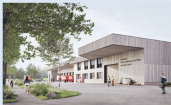
Das Projekt verbindet eine moderne Architektur mit einer zurückhaltenden Gestaltung aus Holz und Stahl (Visualisierung).

In den vergangenen Monaten haben Baukommission und Planungsteam das Projekt vertieft ausgearbeitet und in verschiedenen Bereichen weiter verbessert. Besonderes Augenmerk lag dabei auf einer funktionalen, wirtschaftlichen und nachhaltigen Lösung. Gleichzeitig wurden die Kosten laufend überprüft und kritisch hinterfragt. Aufgrund der allgemeinen Teuerung und der Entwick-