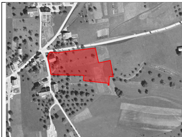
Abbildung 5: Luftbild 1935