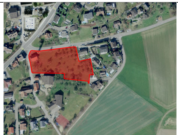
Abbildung 6: Luftbild 2018