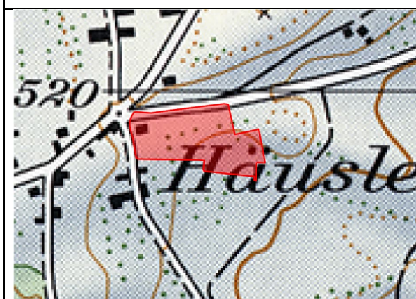
Abbildung 3: Schweizer Landeskarte 1957, 1:25'000