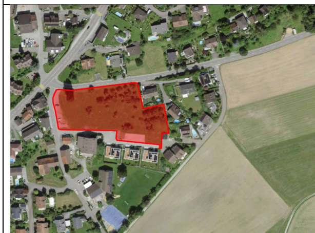
Abbildung 7: Luftbild aktuell