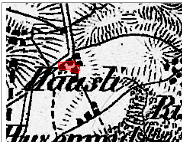
Abbildung 1: Dufourkarte ca. 1850, 1:100'000

Im näheren Bereich der untersuchten Parzelle ist im ältesten Kartenwerk der Schweiz (der Dufourkarte) aus dem Jahre ca. 1850 die Verbindungsstrasse (heute Matzingerstrasse) nach Ristenbühl verzeichnet. In der Siegfriedkarte von 1883 wird im Westen der Parzelle ein Gebäude kartiert. Der grobe Geländeverlauf ist aus den Höhenlinien ersichtlich. Ab 2020 wird in der schweizer Landeskarte der Neubergweg neu aufgeführt und das bisher bestehende Gebäude aus der Karte entfernt.